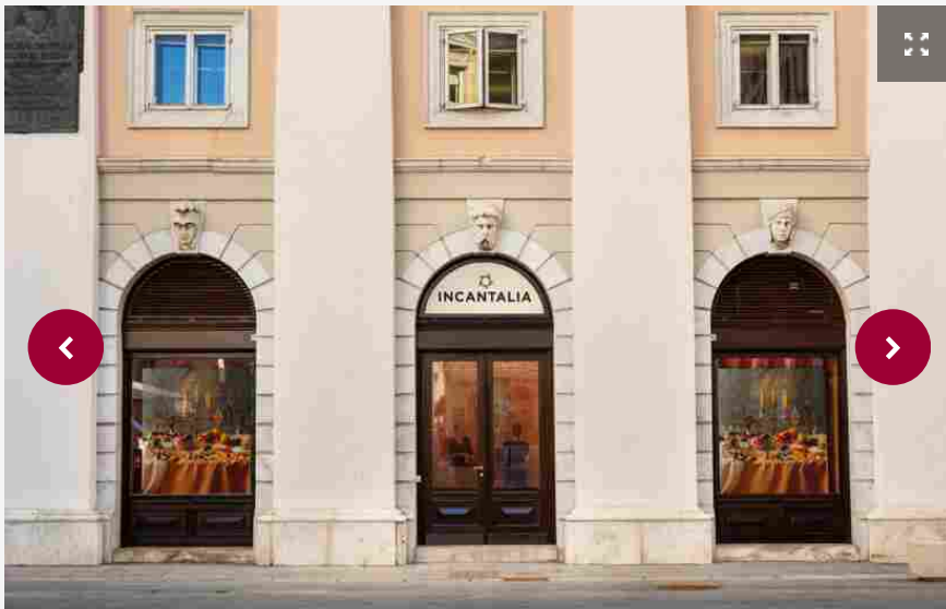
Il primo negozio Incantalia del Polo del Gusto, a Trieste